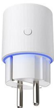
Power off Blue light

No more than 4 hours continuous use in high loaded status