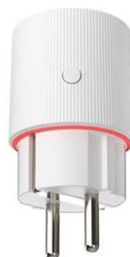
High loaded Red light