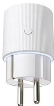
Power on White light