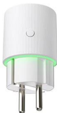
Loaded Green light