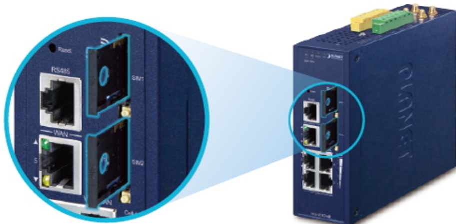
Dual 5G NR