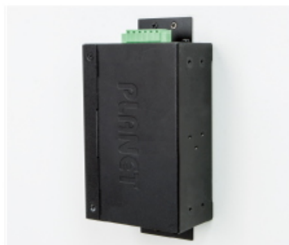
Side Wall Mounting (Space saving)