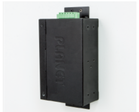
Side Wall Mounting (Space saving)