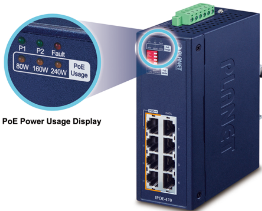
PoE Power Usage Display