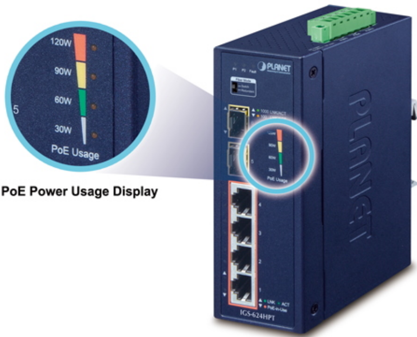
PoE Power Usage Display